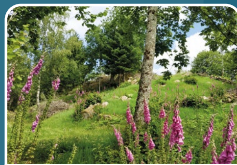
Le Pré Cuna, à Cornimont

Dernièrement, un outil de veille et de gestion a été mis en place grâce à une enquête réalisée auprès des agriculteurs. La CCHV dispose désormais d'une cartographie dynamique pour identifier les terrains à maintenir ouverts ou à rouvrir.