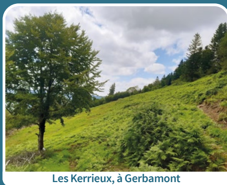
Les Kerrieux, à Gerbamont