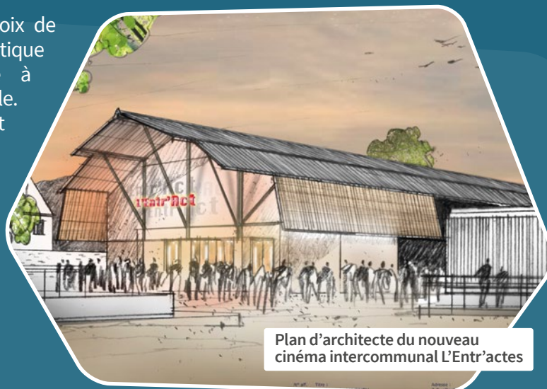
Plan d'architecte du nouveau cinéma intercommunal L'Entr'actes

Vos élus ont fait le choix de poursuivre une politique culturelle et sportive à l'échelle intercommunale.