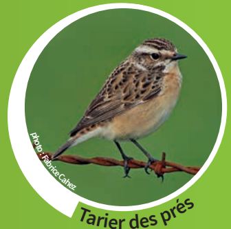
Tarier des prés