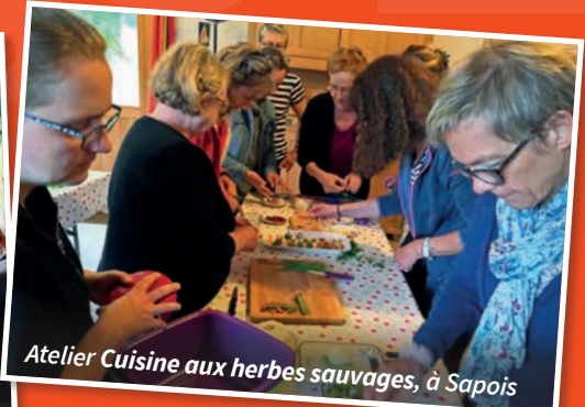
Atelier Cuisine aux herbes sauvages, à Sapois