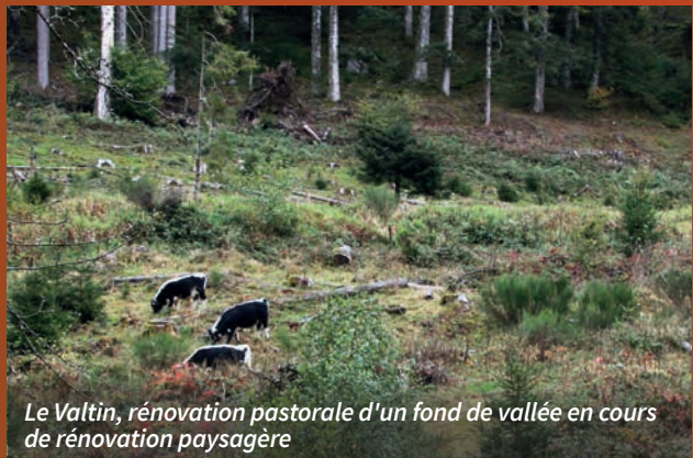
Le Valtin, rénovation pastorale d'un fond de vallée en cours de rénovation paysagère