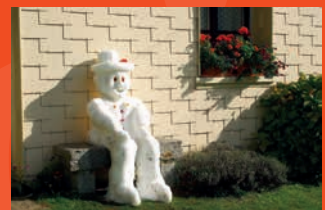
Daniel PERRIN pour la couverture du programme et l'affiche

La communauté de communes remercie les auteurs photographes du concours photo de la Semaine du paysage 2017. Quatre photographies ont été choisies pour illustrer ce programme 2021.