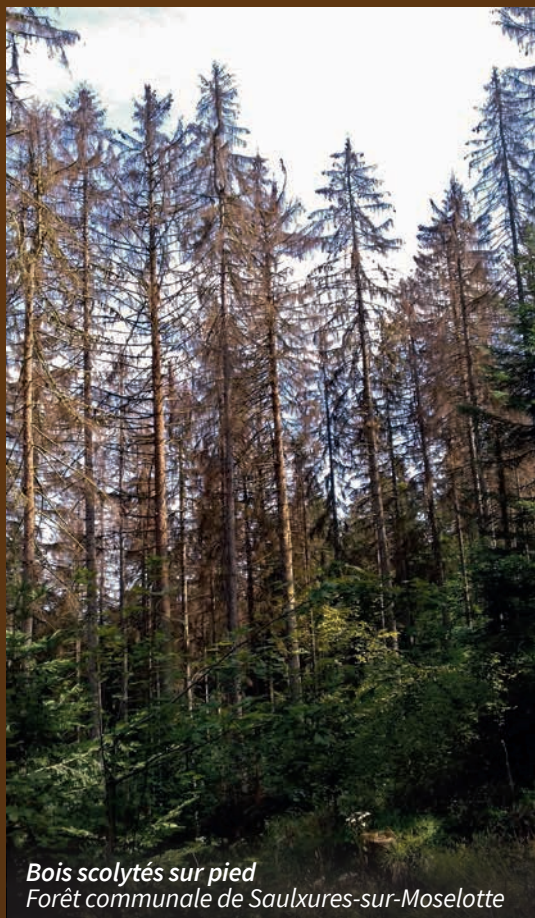
Bois scolytés sur pied Forêt communale de Saulxures-sur-Moselotte

Des plants d'essences provenant d'autres régions, choisies pour leur résistance à la sécheresse, seront introduits en complément, afin de créer de nouveaux peuplements mélangés, plus résilients.