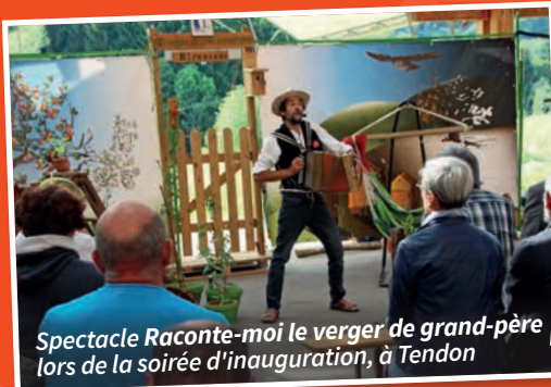
Spectacle Raconte-moi le verger de grand-père lors de la soirée d'inauguration, à Tendon