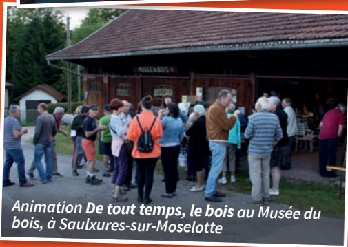
Animation De tout temps, le bois au Musée du bois, à Saulxures-sur-Moselotte