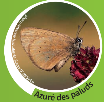
Azuré des paluds